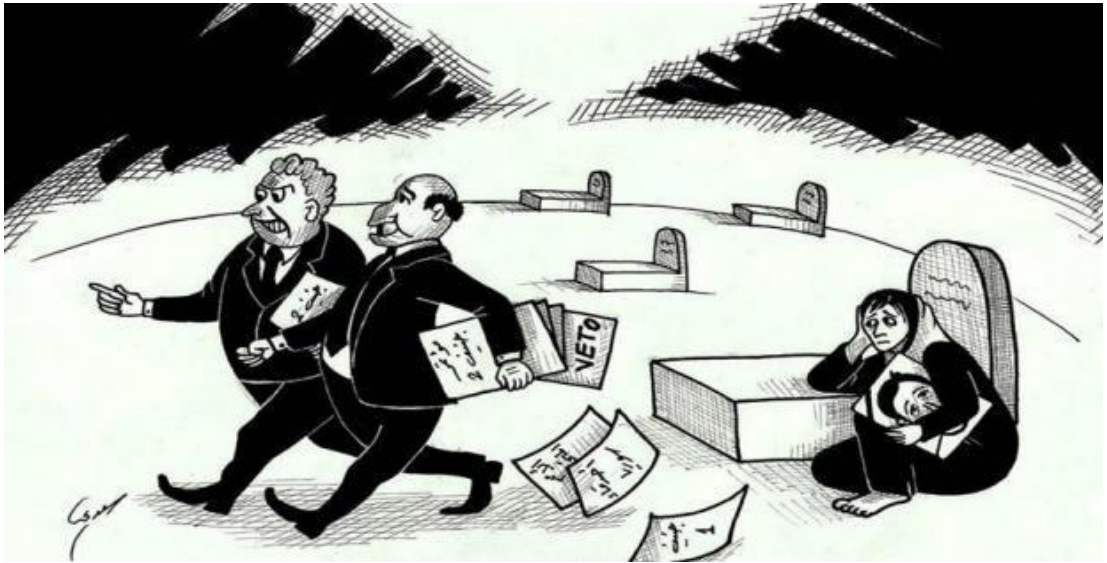
Suriyeli karikaturist: Husam al-Saadi